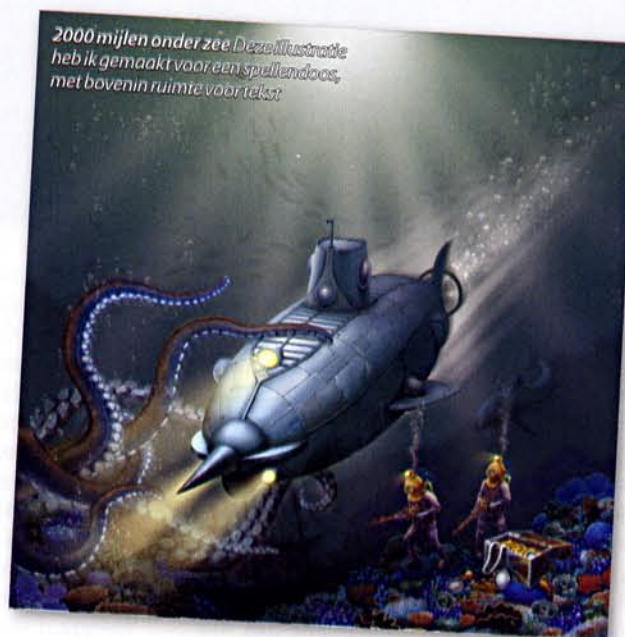
2000 mijlen onder zee Deze illustratie heb ik gemaakt voor een spellendoos, met bovenin ruimte voor tekst.

Wat me inspireert wordt vaak bepaald door de opdracht waar ik op dat moment aan werk. Gelukkig is inspiratie voor mij overal te vinden, bijvoorbeeld in architectuur of mensen op straat. Daarnaast ook in schilderkunst of het werk van kunstenaars die vroeger meegingen op ontdekkingsreizen om alles in tekeningen vast te leggen, het artwork in films, een mooie lucht of het oppervlak van een oude muur.