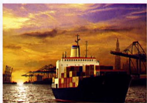
Ports of Europe Ik maakte deze illustratie voor een bordspel, met foto's van water en lucht als basis

H oe en wanneer ben je begonnen met Photoshop? Afbeeldingen maken zit in mijn bloed. Eerst maakte ik altijd tekeningen op papier en in 1996 kocht ik mijn eerste computer met tekentablet en Photoshop 5. Ik heb het meeste geleerd door veel met Photoshop te experimenteren. De eerste keer dat ik een illustratie digitaal aanleverde was heel spannend, ik had geen idee of het er gedrukt wel goed uit zou zien.