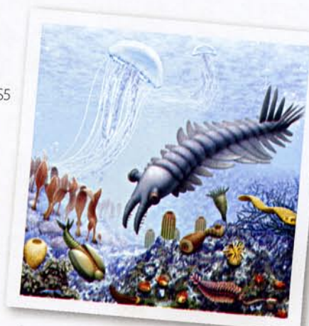
Cambrum zee Dit geeft een beeld van het zeeleven zo'n 510 miljoen jaar geleden, voor een biologieboek

De laatste tijd gebruik ik graag een gescande tekening als basis voor een uitwerking in Photoshop. Zo'n combinatie van 'echt' en pixels brengt er iets handmatigs in. Het moet niet te perfect zijn, ik streef naar meer human touch. In de toekomst zul je illustraties van me zien in een ruwere, meer handmatige stijl.