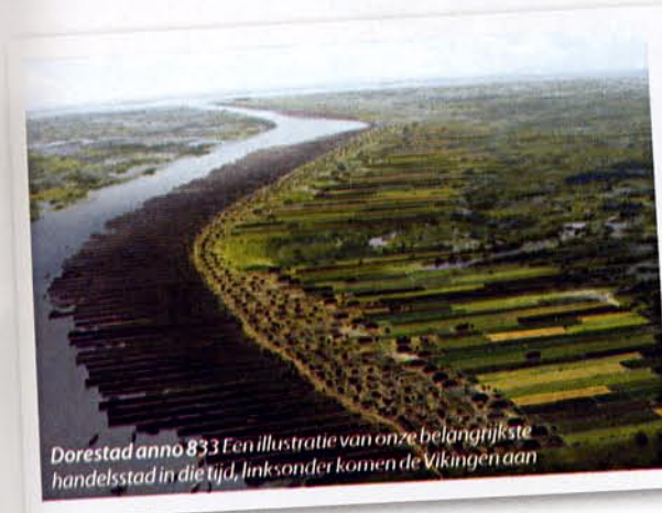
Dorestad anno 833 Een illustratie van onze belangrijkste handelsstad in die tijd, links onder komen de Vikingen aan

Ik ben heel enthousiast over Photoshop en wil er als docent nog beter in worden om dit aan anderen over te brengen. Ik werk er dagelijks mee en doe nog steeds geweldige ontdekkingen. Er is trouwens